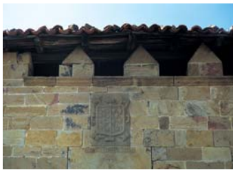
Llano dorrearen armarría

Garai honetan zehar, Sopusuertan inguruko leinurik garrantzitsuenen (San Cristóbal, Mendieta, Alcedo, Llano, Muñatones, Urrutia, Quintanak...) arteko hainbat borroka egon ziren. Eta ondorioz, garai gatazkatsu honen isla dira, oraindik ere, ikusi ahal ditugun zenbait defentsadorre.