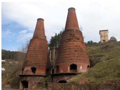
← La Lindeko Labeak Antzinako trenbidea →

Beraz, Sopuertari dagokion meatze-iragana aldarrikatu behar dugu, batzuek ahaztuta daukatelako. Izan ere, ateratzen zen burdin mea Castro Urdialesera eta Saltacaballosera eramaten zen eta ez zen Bizkaian aintzakotzat hartzen.