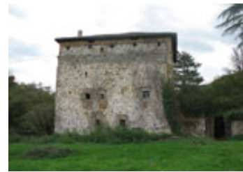
La Puente dorretxea

Bestalde, Abellanedako Batzar Nagusiak ere garai honetan sortu ziren. Hasiera batean, Batzar hauek leinu ezberdinen arteko auziak eztabaidatzeko lekua izan ziren, eskualdeko erakunde kudeatzailea baino.